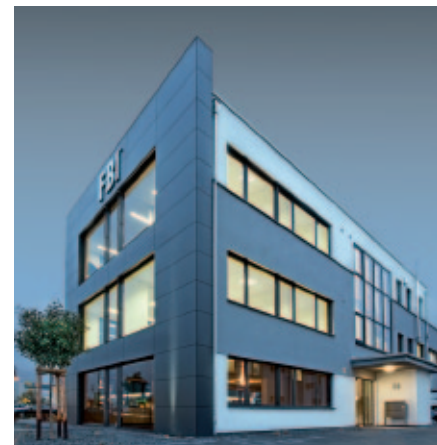
Zentrale Bad Kreuznach